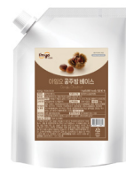
공주밤 베이스 규격 : 1 kg x 12 ea / box 소비기한 : 제조일로부터 1년