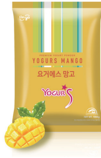
요거S 블루베리 규격 : 1 kg x 12 ea / box 소비기한 : 제조일로부터 2년