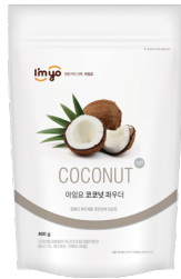
코코넛 파우더 규격 : 800g x 12ea / box 소비기한 : 제조일로부터 2년