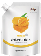
망고 베이스 규격 : 1 kg x 12 ea / box 소비기한 : 제조일로부터 1년 6개월