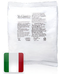
프리미엄 요거트 파우더 규격 : 1 kg x 12 ea / box 소비기한 : 제조일로부터 5년 원산지 : 이탈리아