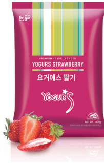
요거S 망고 규격 : 1 kg x 12 ea / box 소비기한 : 제조일로부터 2년