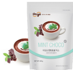
민트초코 믹스 규격 : 800g x 12ea / box 소비기한 : 제조일로부터 2년