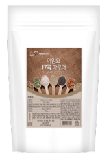
17곡 파우더 규격 : 800 g x 12 ea / box 소비기한 : 제조일로부터 1년