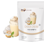
슈크림 믹스 규격 : 1 kg X 12 ea / Box 소비기한 : 제조일로부터 2년