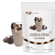
쿠키앤크림 규격 : 1 kg X 12 ea / Box 소비기한 : 제조일로부터 2년