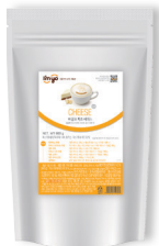
치즈 베이스 규격 : 800 g x 12 ea / box 소비기한 : 제조일로부터 2년