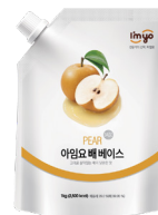
배 베이스 규격 : 1 kg x 12 ea / box 소비기한 : 제조일로부터 1년 6개월