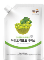
청포도 베이스 규격 : 1 kg x 12 ea / box 소비기한 : 제조일로부터 1년 6개월