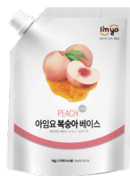
복숭아 베이스 규격 : 1 kg x 12 ea / box 소비기한 : 제조일로부터 1년 6개월