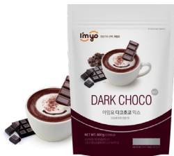
다크초코 믹스 규격 : 800g x 12ea / box 소비기한 : 제조일로부터 2년

진한 초코의 풍미와 달콤함이 가득한 아임요 초코 믹스 시리즈로 깊은 초코의 맛을 즐겨보세요 라떼, 프라페, 스무디 등 다양한 종류의 음료도 사용 가능합니다