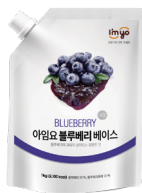
블루베리 베이스 규격 : 1 kg x 12 ea / box 소비기한 : 제조일로부터 1년 6개월