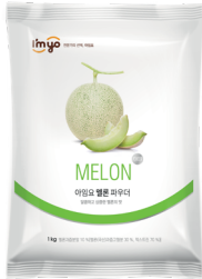
멜론 파우더 규격 : 1kg x 12ea / box 소비기한 : 제조일로부터 2년