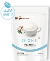
코코넛 믹스 규격 : 800 g x 12 ea / box 소비기한 : 제조일로부터 2년