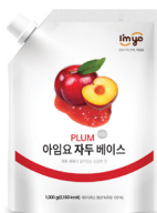
자두 베이스 규격 : 1 kg x 12 ea / box 소비기한 : 제조일로부터 1년 6개월