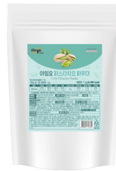
피스타치오 파우더 규격 : 1kg x 12ea / box 소비기한 : 제조일로부터 2년