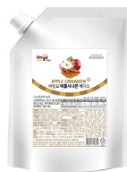
애플 시나몬 베이스 규격 : 1 kg x 12 ea / box 소비기한 : 제조일로부터 1년 6개월