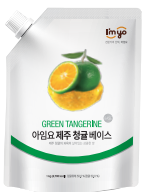
제주 청귤 베이스 규격 : 1 kg x 12 ea / box 소비기한 : 제조일로부터 1년 6개월