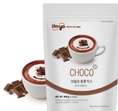
초코 믹스 규격 : 800g x 12ea / box 소비기한 : 제조일로부터 2년