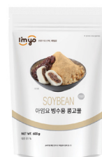
빙수용 콩고물 규격 : 600 g X 20ea / box 소비기한 : 제조일로부터 1년