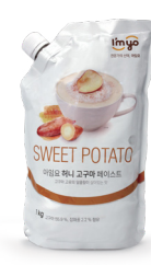
허니 고구마 페이스트

규격 : 1.5 L x 6ea / box 소비기한 : 제조일로부터 1년 6개월