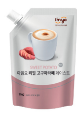
리얼 고구마라떼 페이스트

규격 : 1 kg x 12 ea / box 소비기한 : 제조일로부터 1년