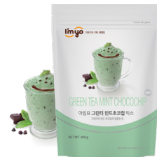
그린티 민트초코칩 믹스 규격 : 800g x 12ea / box 소비기한 : 제조일로부터 2년