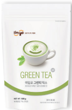
그린티 믹스 규격 : 500 g x 12 ea / box 소비기한 : 제조일로부터 2년