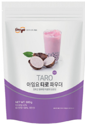
타로 파우더 규격 : 500g x 12ea / box 소비기한 : 제조일로부터 2년

아임요 파우더는 원재료 함량을 높여 고유의 맛과 향이 살아 있으며, 버블티 / 라떼 / 스무디 등 다양한 종류의 음료로 활용이 가능합니다