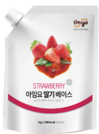
딸기 베이스 규격 : 1 kg x 12 ea / box 소비기한 : 제조일로부터 1년 6개월

아임요 과일베이스는 과육이 살아있어 과일 본연의 깊고 진한 맛을 느낄 수 있는 제품으로 스무디, 에이드 및 빙수 아이스크림 등 다양한 메뉴의 토피ంగ으로도 활용 가능합니다