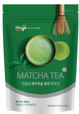
제주하늘 말차 파우더 규격 : 500g x 12ea / box 소비기한 : 제조일로부터 2년