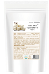
화이트 누가 파우더 규격 : 500g x 12ea / box 소비기한 : 제조일로부터 2년