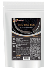
흑임자 파우더 규격 : 800g x 12ea / box 소비기한 : 제조일로부터 1년