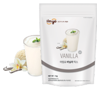
바닐라 믹스 규격 : 1 kg X 12 ea / Box 소비기한 : 제조일로부터 2년