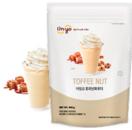
토피넛 파우더 규격 : 800 g X 12 ea / Box 소비기한 : 제조일로부터 2년

고품질 원재료를 사용하여 찬 음료에도 잘 녹고 진한 바디감을 자랑하는 프라페 시리즈입니다.