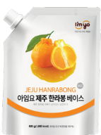
제주 한라봉 베이스 규격 : 800g x 12ea / box 소비기한 : 제조일로부터 1년 6개월