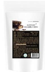
블랙 누가 파우더 규격 : 500g x 12ea / box 소비기한 : 제조일로부터 2년