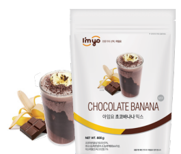
초코바나나 규격 : 800g x 12ea / Box 소비기한 : 제조일로부터 2년